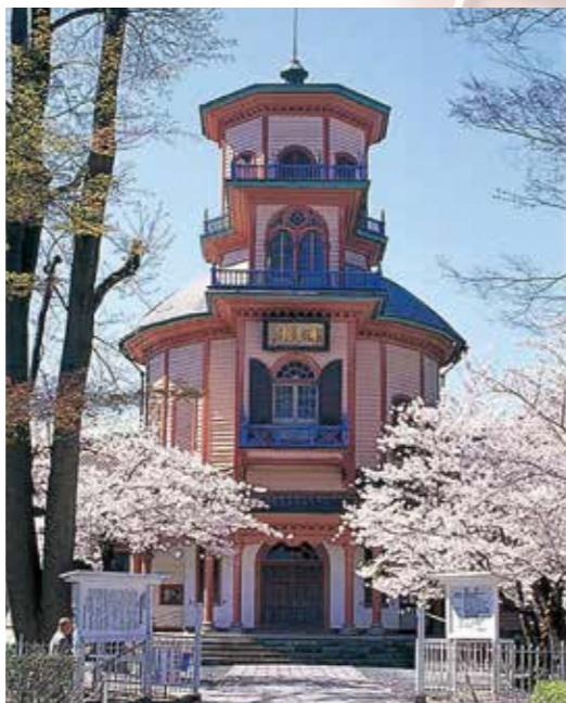
6 山形市郷土館(旧済生館本館) 明治11年(1878)に県立病院「済生館」として建築。3層建ての擬洋風建築で、昭和41年(1966)に国重要文化財に指定。昭和44年(1969)に現在地に移築、昭和46年(1971)に「山形市郷土館」として開館。