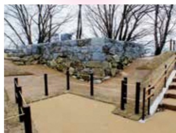
15 坤櫓(ひつじさるやぐら)