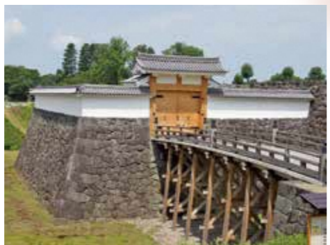
12 本丸一文字門石垣・大手橋・高麗門・枡形土塀 現存する絵図面を元に、平成15年に石垣、平成17年に大手橋、平成26年に高麗門及び枡形土塀を復元。