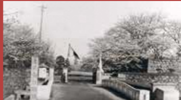
昭和初期の山形城跡(二ノ丸東大手門跡)