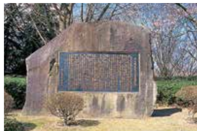
3 山形城主最上義光顕彰石碑 義光の歴史と功績を讃えた石碑。(昭和52年建立)