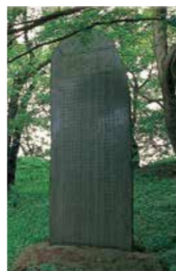
11 山形城墟碑 明和4~弘化2年(1767~1845)、山形城主を務めた秋元家の旧跡碑文。子孫秋元春朝子爵が大正10年(1921)に謹選。