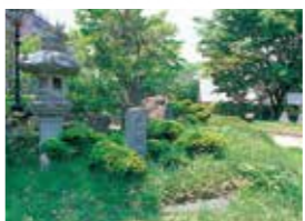
27 光明寺跡(光明の庭) 兼頼の菩提寺光明寺跡。(昭和52年建立)