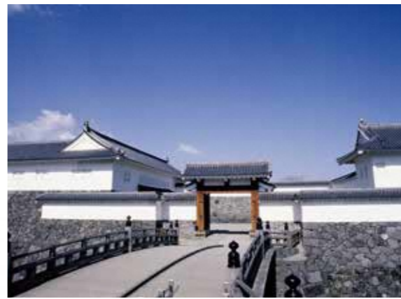
1 二ノ丸東大手門 櫓門・多門櫓・高麗門・土塀を備えた山形城二ノ丸の正門を、史実に従い日本古来の建築様式により木造建で平成3年(1991)に復元。