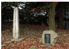
28 水野三郎右衛門宅址 山形城最後の城主水野家老で、明治維新の際身を以て難に殉じた市民を戦禍から救った元宣の宅址。(昭和29年建立)