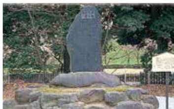
7 木村逸堂寿蔵碑 明治7年(1874)、山形県公立病院の創立にあたり、同医局の教師、医員を任せられた人物。(明治18年建立)