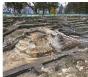
26 本丸西堀埋門 埋門土橋(うずみもんどばし)は門のひとつですが、非常時に木橋を架けて本丸と二ノ丸を繋げたものと考えられます。