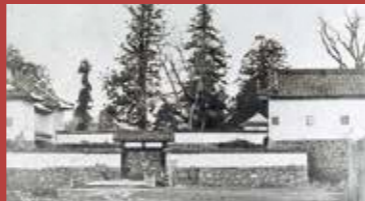
明治初期の山形城跡ノ丸東大手門