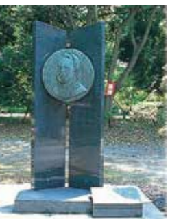
8 ローレツ像 明治初期に診療、西洋医学の発展に寄与した山形県済生館医学寮教頭を務めたオーストリア人医師。(昭和45年建立)