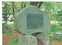
19 金澤忠雄謹書碑 高橋月甫の言葉「幸福は今日も朝から禪かけ」を元山形市長金澤忠雄氏が在任中に建立。