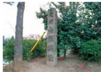
22 山形城址碑 東大手門復元前、東門に建立されていた碑。(昭和2年建立)