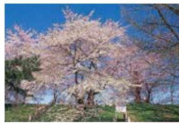
17 霞城の桜 兼頼が山形城築城の際に植えたといわれるエドヒガン。古木。(樹高12.5m、根周7.8m・市指定天然記念物)