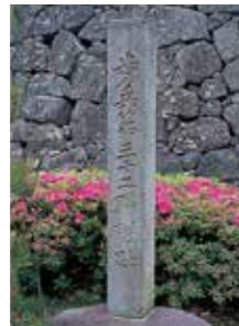
21 歩兵第三十二連隊跡碑 第十五代連隊長後藤寿三郎が建立。書は元山形県知事安孫子藤吉。(昭和39年建立)