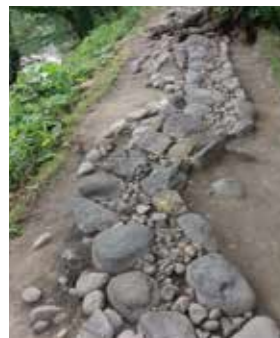
25 全国初! 屏風折土塀 全国で初めて発見された貴重な礎石です。いろんな城郭の城絵図に描かれていましたが、痕跡は見つかっていませんでした。土塀が折れ曲がっていることで防御力を高める効果があり、城の北方の防御を固めようとした意図が感じられます。