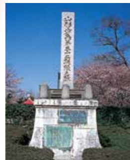
4 歩兵第三十二連隊碑 歩兵第三十二連隊本営(明治29年~終戦駐屯)の初代から31代までの歴代連隊長名が記載。(昭和34年建立)