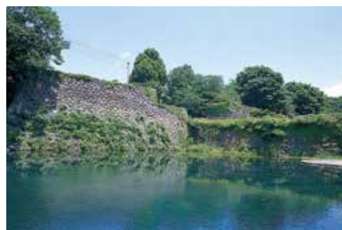
14 南門(二ノ丸南大手門跡) 16 西門(二ノ丸西不明門跡) 20 北門(二ノ丸北不明門跡)