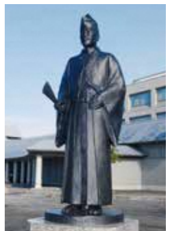
29 最上義光像 義光の優れた文人としての側面に光をあて「文化の義光、人間義光を表現した」像(平成28年建立)