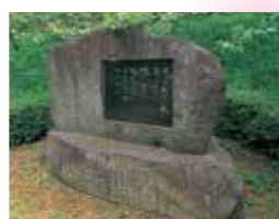
10 佐藤総右詩碑 県芸文会議の常任理事として広く山形の芸術文化の向上に尽くした山形市出身の詩人(昭和59年建立)。