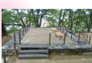
13 巽櫓(たつみやぐら)