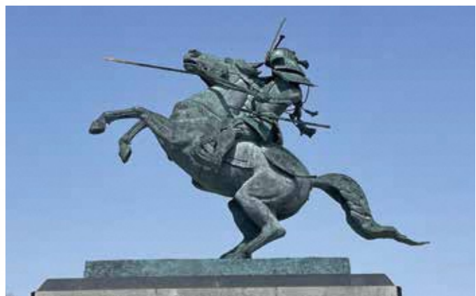
2 最上義光騎馬像 上杉景勝の重臣直江兼続が攻めてきた際、義光自らが陣頭となって決戦の場へ向かっていく勇姿を山形鎗物で再現。(昭和52年建立)