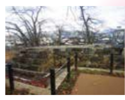
24 長櫓(うしろやぐら)