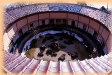
2階講堂からの眺め