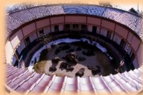
2층 강당에서 바라본 풍경

구 사이세이칸 본관은 초대 야마가타현령 미시마 미치츠네(三島通庸)의 명예 따라 1878년에 준공된 의양풍 건축양식의 병원입니다.