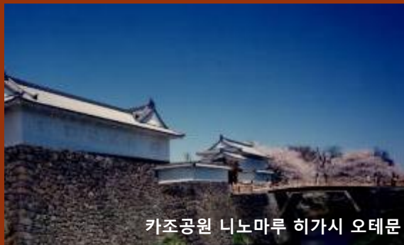
카조공원 니노마루 히가시 오테문