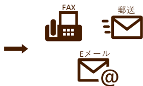
健康増進課へ送付