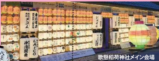
歌懸稲荷神社メイン会場

子どもたちの願いちょうちんと一緒に広がる「天の川ゾーン」には、ちょうちん形の短冊に願い事を書いた“ちょうちん短冊”と、創作花笠「わたしの花笠」が飾られています。