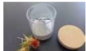
【紅花とお香でひらく古典の世界～最上川から京の雅へ～】