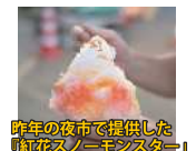
昨年の夜市で提供した「紅花スノーモンスター」

「紅花スノーモンスター」山形の「紅花」と、蔵王の「樹氷(スノーモンスター)」をイメージした、山形らしさたっぷりのかき氷。山形おいしい楽しい夜市で、数量限定販売です。