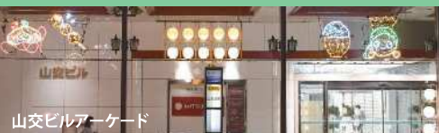
山交ビルアーケード