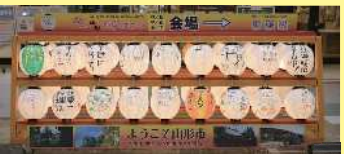
エスパル山形前山車3台