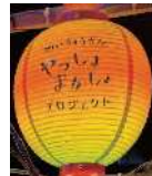
山形らしいちょうちんが会場を彩ります