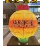
シンボルちょうちん 縦1.9M・横1.5M