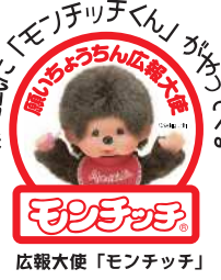
広報大使「モンチッチ」

祭 点灯式 祭 7月10日(金) 18:00～18:30 (歌懸稲荷神社) 山形市十日町1丁目1-26