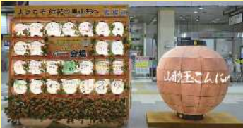
山形駅改札口前山車2台・シンボルちょうちん

子どもたちの願いちょうちんが、観光客はもちろん、市民・県民の皆さまをあたたかくおもてなします。