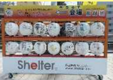
山形駅ベストリアンデッキ山車7台