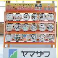
山形駅東西自由通路山車4台