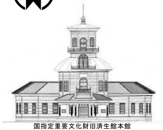
国指定重要文化財旧済生館本館