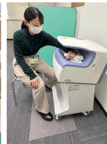
骨粗しょう症検診の様子