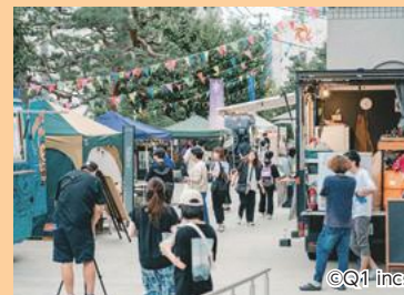
やまがたクリエイティブシティセンターQ1