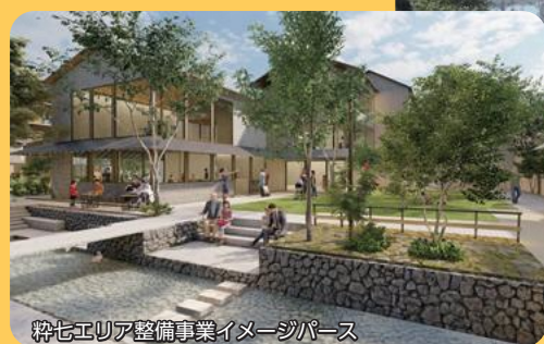
粉七エリア整備事業イメージパース