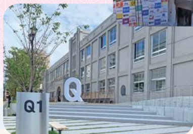
やまがたクリエイティブシティセンターQ1