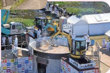
日本一の芋煮会 フェスティバル