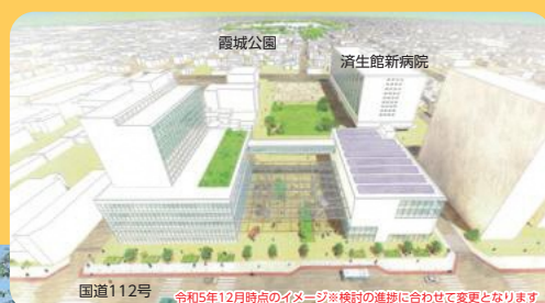
国道112号 令和5年12月時点のイメージ※検討の進捗に合わせて変更となります 七日町賑わい創出拠点整備事業完成イメージパース