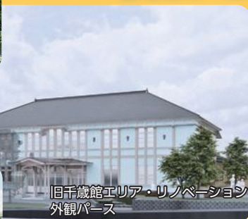
旧千蔵館エリア・リノベーション 外観パース