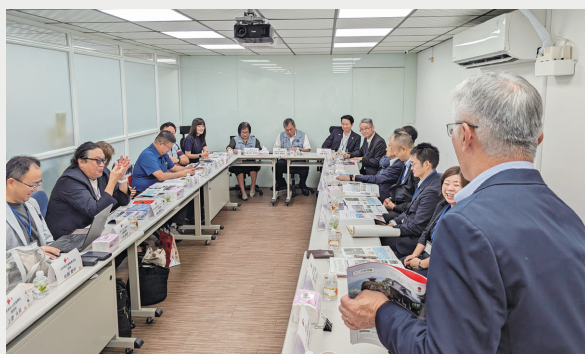
▲台南市の旅行事業者と意見交換