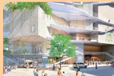
新市民会館イメージパース