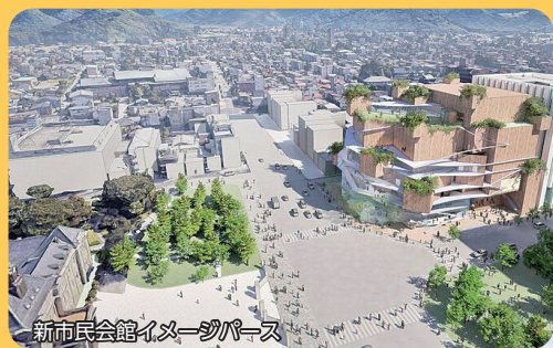
新市民会館イメージパース