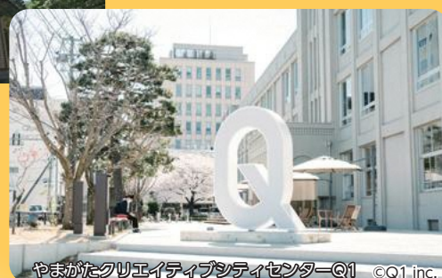
やまがたクリエイティブシティセンターQ1