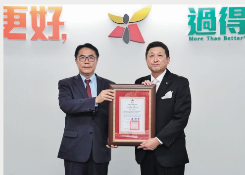
▲(左)黄偉哲台南市長、(右)長谷川幸司議員