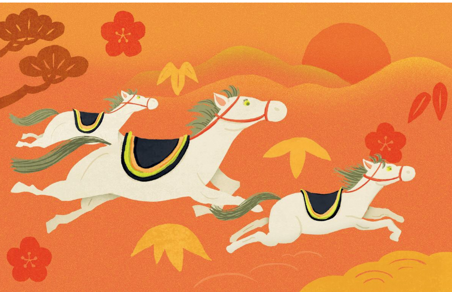
イラスト:地域おこし協力隊 高安恭介