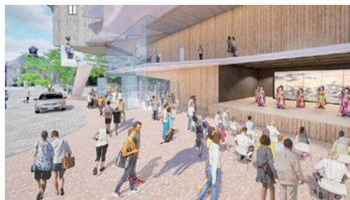
▲七日町通りに開かれた大スタジオ