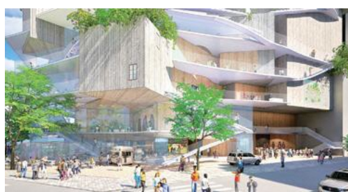
▲まちと一体感をもたらす開かれた空間

エントランスに入ると広がる木陰のような交流ラウンジでは、パブリックビューイングができたり、カフェがあったり、奥にスタジオがあったりと、さまざまな世代の人が思い思いの時間を過ごせるような場所です。また、3つの貸しスタジオはガラス張りの壁にし、中の雰囲気が見えることで、通りがかった人の興味を引きつけるような仕掛けにしています。