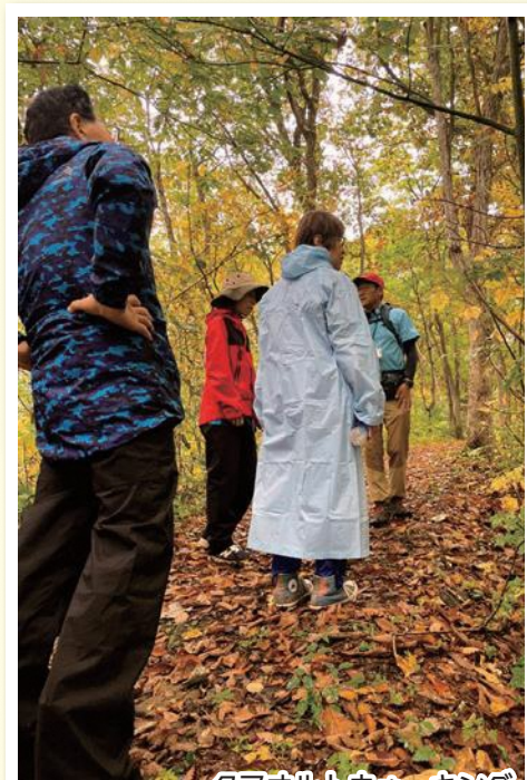
クアオルトウォーキング