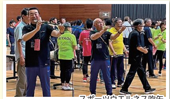
スポーツウエルネス吹矢