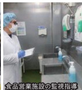
食品営業施設の監視指導