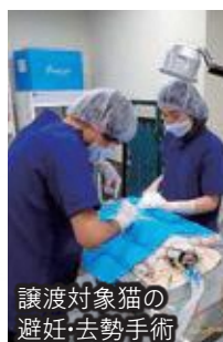
譲渡対象猫の 避妊・去勢手術