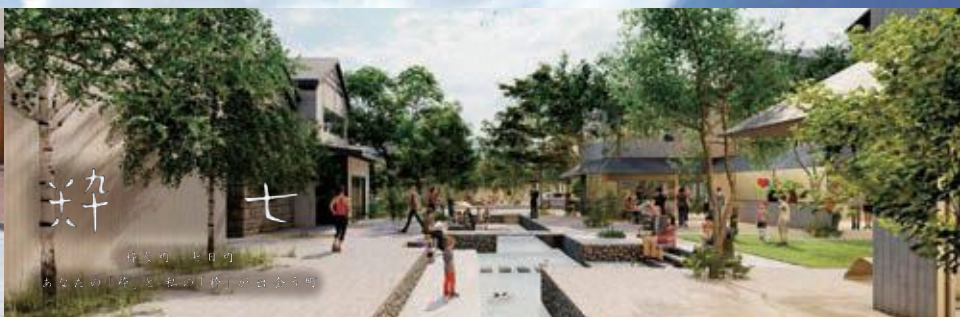
絆 七 絆を育み、絆を あなたの「絆」を「絆」が育むまち