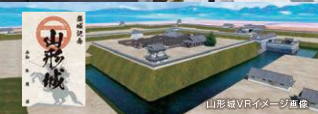
山形城VRイメージ画像