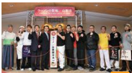
ラーメン消費額2年連続日本一