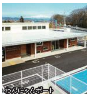
わんにゃんポート