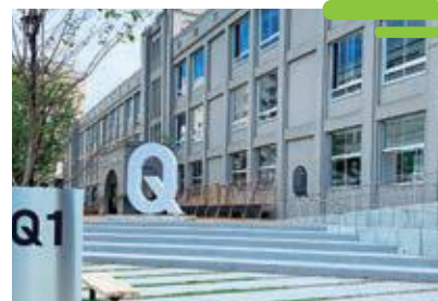
やまがたクリエイティブシティセンターQ1