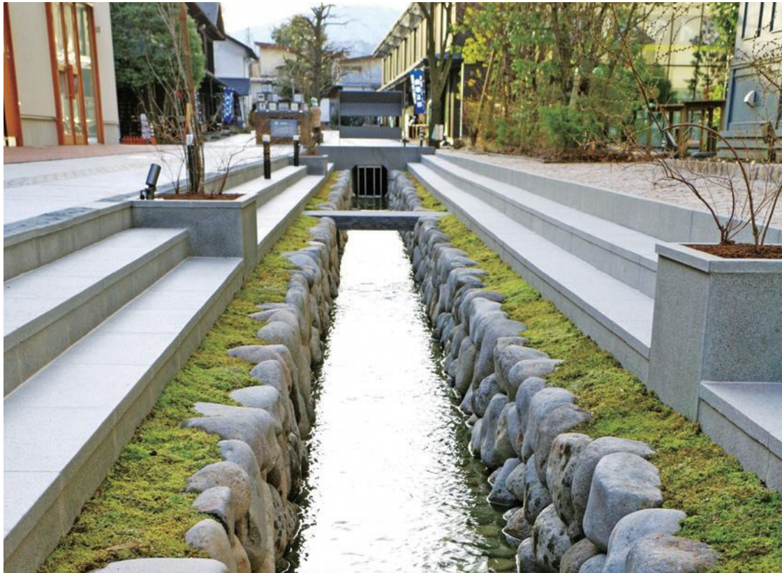
こてんぜき 御殿堰 (十一屋七日町本店脇) 3月29日完成