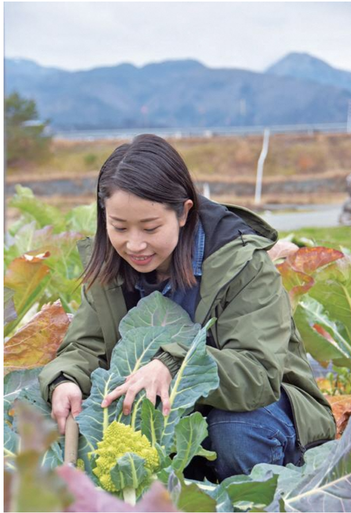
山形市の農業を未来につなぐ