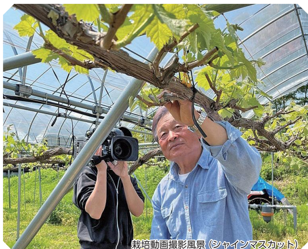
栽培動画撮影風景（シャインマスカット）

山形市における栽培技術の動画を含めた多品目の栽培技術動画の配信と、栽培工程を適切に管理するための生産履歴システムを導入し、新規就農者が就農定着できるような環境づくりをしていきます。