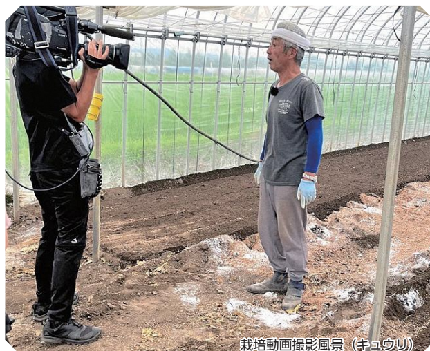
栽培動画撮影風景（キュウリ）