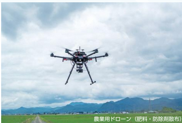
農業用ドローン（肥料・防除剤散布）

市長を本部長に有識者8人の本部長からなる組織。平成28年5月から、山形市の農業が抱える諸問題の解決策を探り、具体的な戦略の構築を目指し農業振興を図っています。