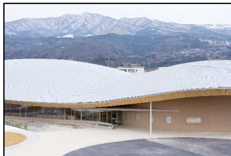
シェルターインクルーシブプレイスコパル 9