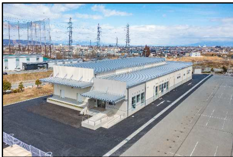
山形広域炊飯施設