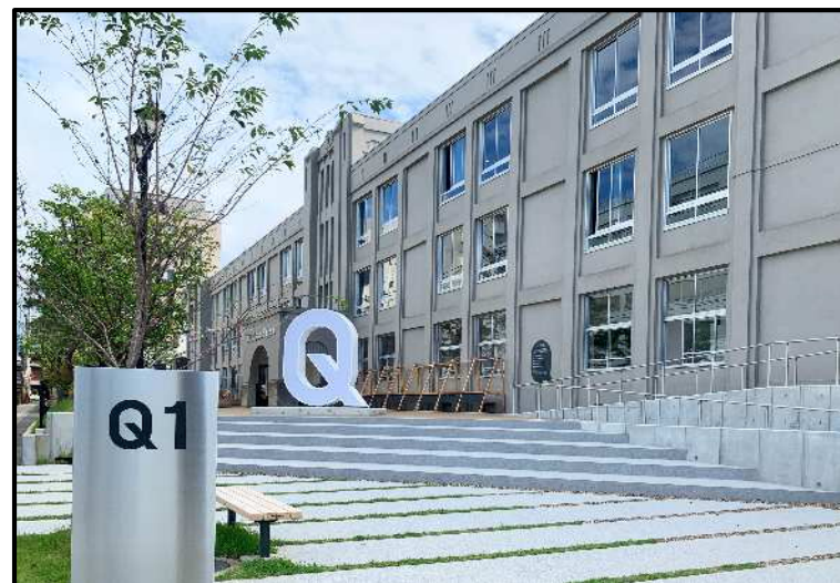
やまがたクリエイティブシティセンターQ1