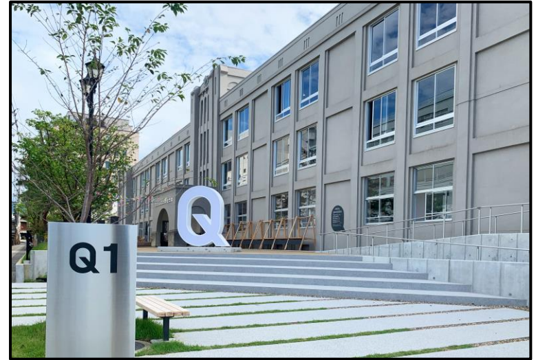
やまがたクリエイティブシティセンターQ1