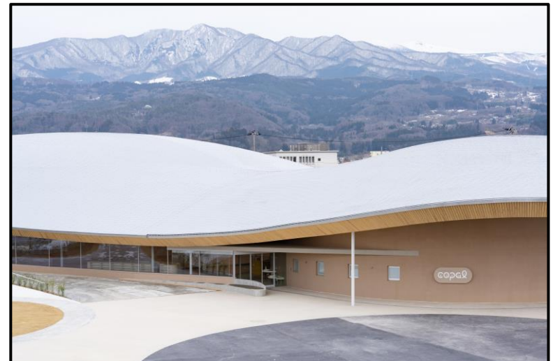
シェルターインクルーシブプレイスコパル 9