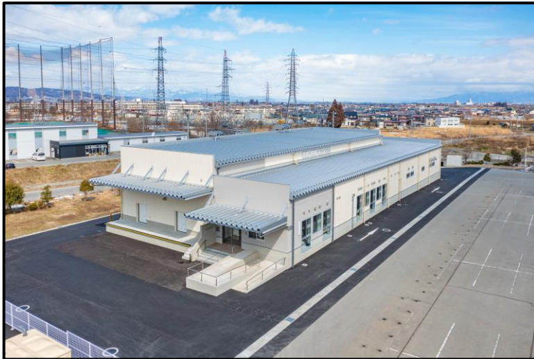
山形広域炊飯施設