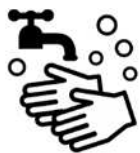
石けんによる手洗い