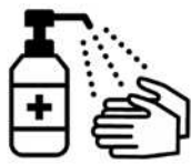
手指消毒用アルコールによる消毒の励行