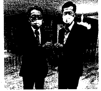
タイの元副首相ポンテープ氏と山形とタイの交流推進を約束