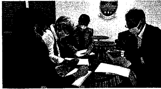
タイのナンファーチャイディ協会と打合せ