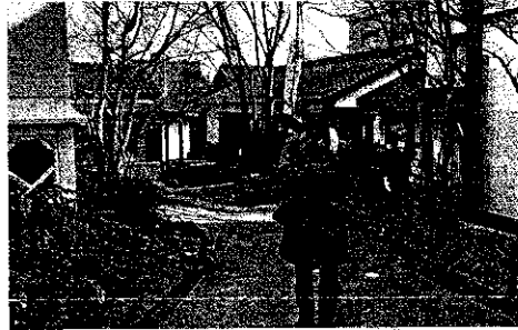
長野市のまちづくりを視察