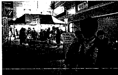
七日町一帯ドリンクテーリング大会