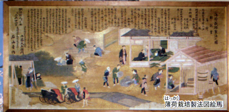
(ほか) 薄荷栽培法図絵馬