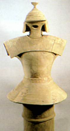
菅沢三号墳出土 埴輪