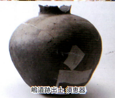
鳴遺跡出土 須恵器