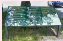
▲閑静な街並みの中の案内板