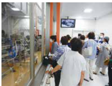
▲山形広域炊飯施設の見学