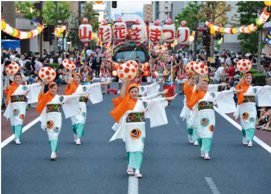
笑顔 咲き誇る 山形の夏