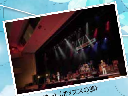
平和コンサート(ポップスの部)