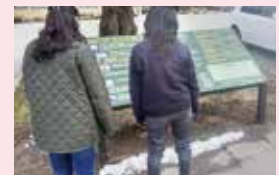
▲思わず見入ってしまいます