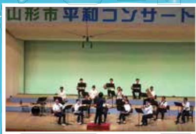
平和コンサート(器楽・合唱の部)