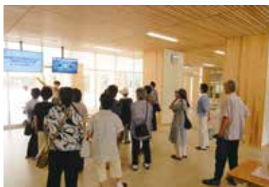
▲山形商業高校の校舎見学