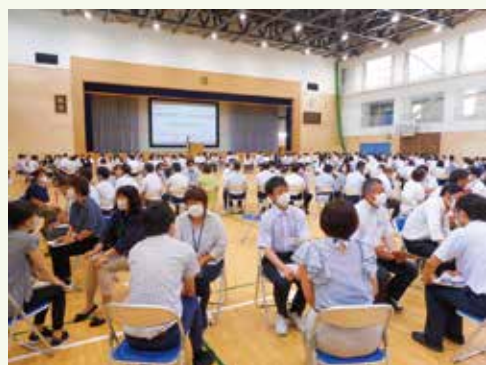
【トークフォークダンスの様子】

今後は、対話の心得を体得した山形市職員が地域の中に入り込むことによって、「対話」を市役所だけでなく、山形市の文化として根付かせていきたいです。