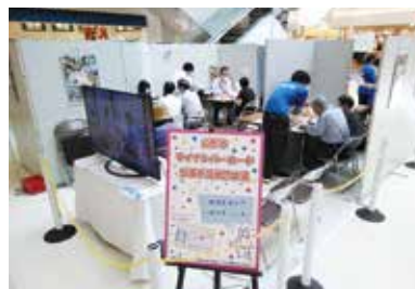
▲イオンモール山形南の出張受付