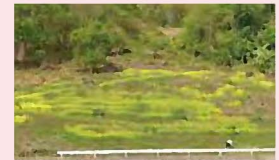
▲咲き誇る菜の花（5月）