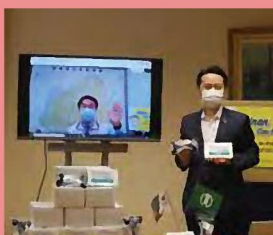
感染対策グッズ受贈

37人の市民訪問団を台南市に派遣。台南市長への表敬訪問や台南市政府主催の歓迎晩さん会で、台南市の皆さんから盛大な歓迎を受ける。新光三越「日本商品展」の山形市物産プロモーション視察等を行い、さらなる交流を誓う。