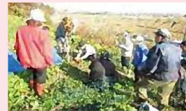
▲雪囲い・害獣対策作業