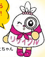
減量かなえちゃん