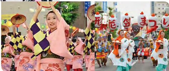
▲令和元年の花笠まつり