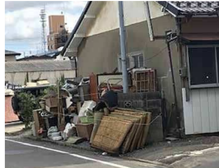
▲令和元年東日本台風による片付けごみの排出状況(福島県郡山市)