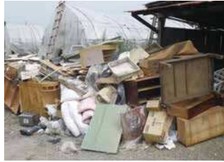
▲令和2年7月豪雨による片付けごみの発生状況(山形市)