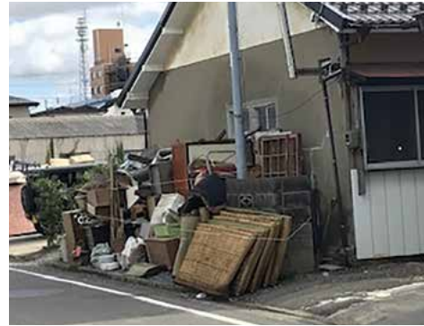
▲令和元年東日本台風による片付けごみの排出状況(福島県郡山市)