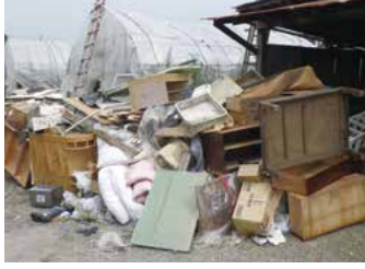
▲令和2年7月豪雨による片付けごみの発生状況(山形市)