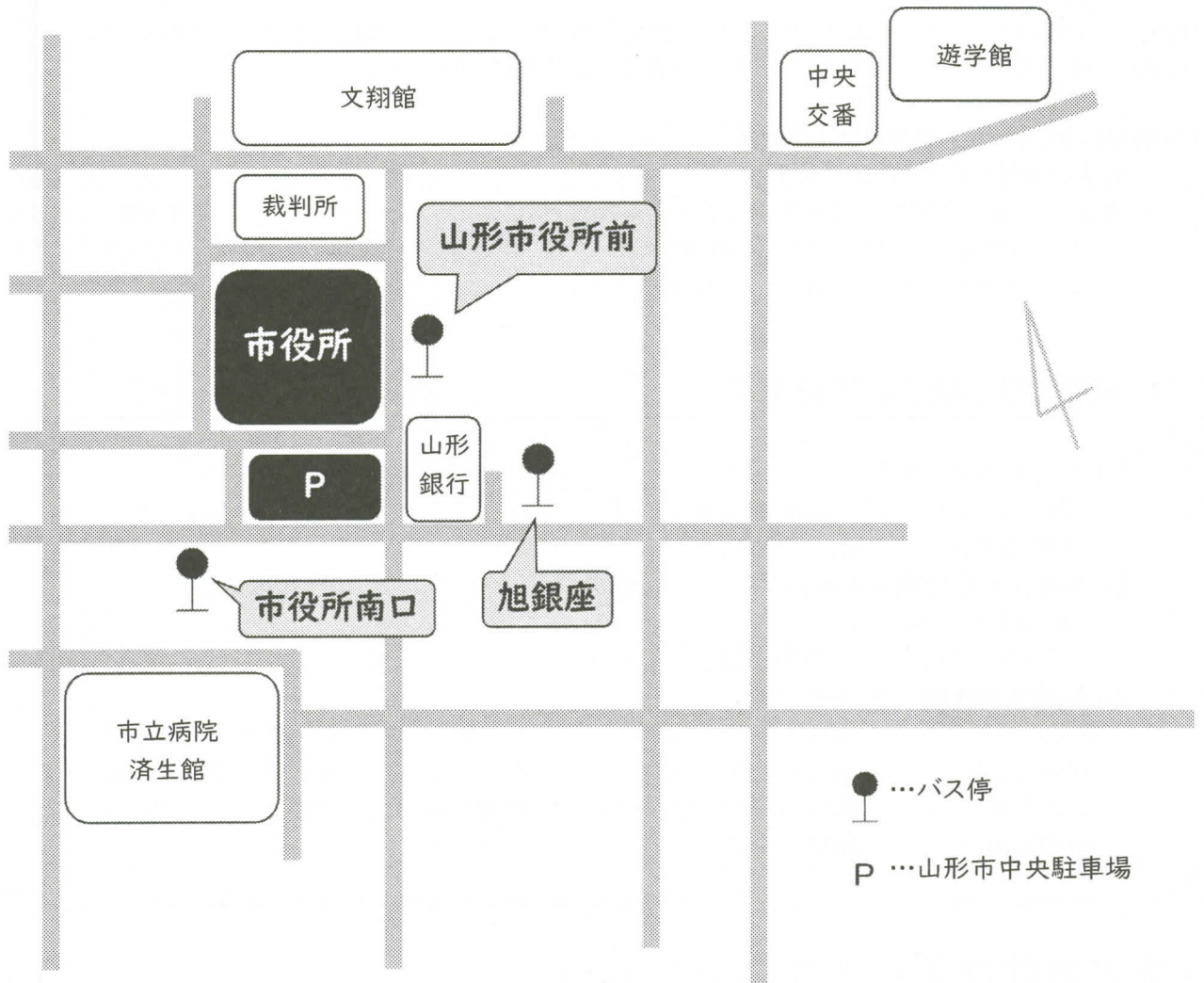
【市役所へのアクセス】