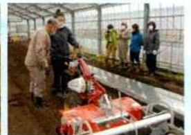
現地視察や機械研修のオプション研修も充実