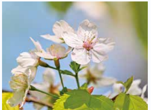
▲世界でここにしかないミヤマカスミザクラ