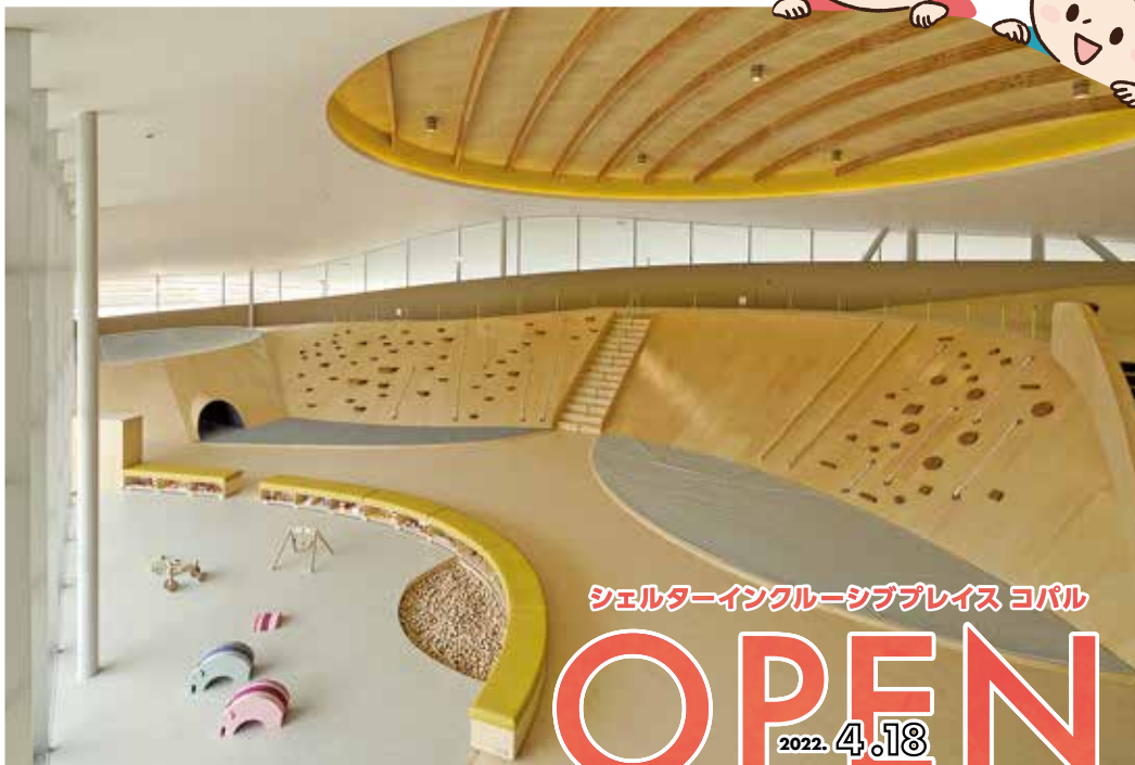
シェルターインクルーシブプレイス コパル