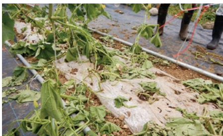
▲ イノシシにより食い荒されたカボチャ畑

市では、山形猟友会員の中から、129人を鳥獣被害対策実施隊員として委嘱しています。実施隊員は、捕獲活動だけでなく、サル追い払いパトロールなど、農作物被害防止活動に取り組んでいます。昨年度は、実施隊による積極的な捕獲により、前年度比111頭増の400頭のイノシシを捕獲。しかし、捕獲だけでは繁殖力が強いイノシシによる被害は食い止められません。