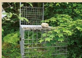
▲イノシシ捕獲用の箱わな