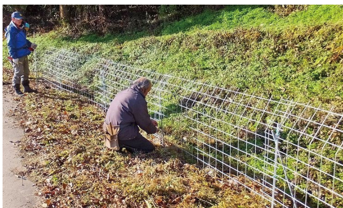
▲ワイヤーメッシュ柵の設置

市では有害鳥獣対策に取り組む方や地域への支援として、左記のような助成を行っています。