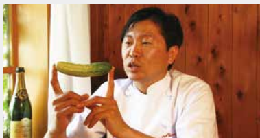
映画 「よみがえりのレシピ」より