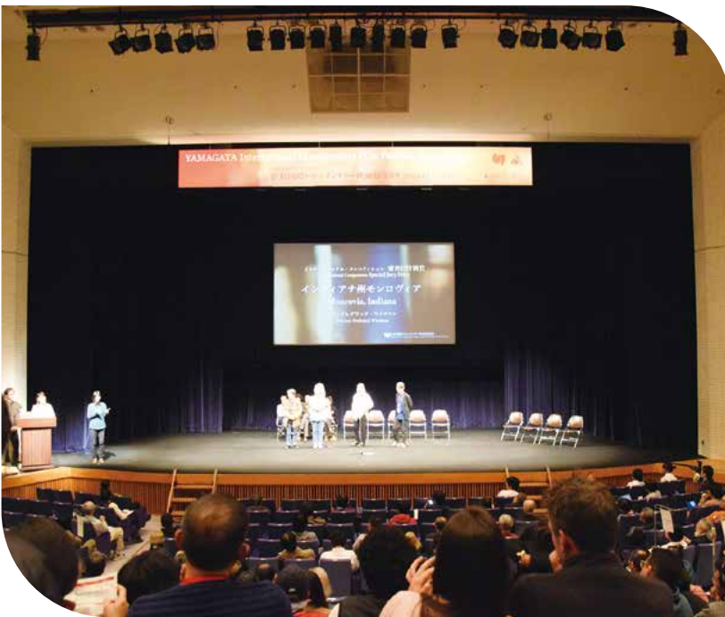
▲第16回山形国際ドキュメンタリー映画祭の様子▶