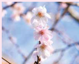
▲ジュウガツザクラ

◎色づく木の実や紅葉が見頃を迎えます。 野草園ブログで最新の情報をご覧ください。