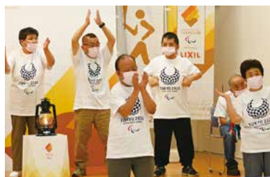
▲ビジットセレモニー (まんさくの丘)

理解を深めていただくきっかけになりました。ご覧になれなかった方にもパラリンピック聖火フェスティバルを知ってもらい、楽しんでいただくため、その様子を動画で公開しています。ぜひご覧ください。