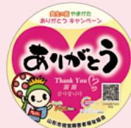
▲ステッカーのイラスト