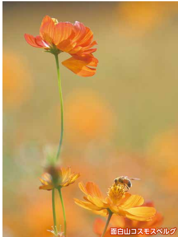
面白山コスモスベルグ