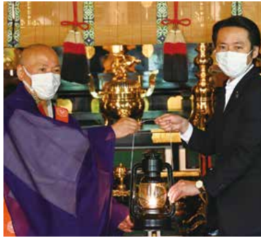
▲採火式 (山寺立石寺)