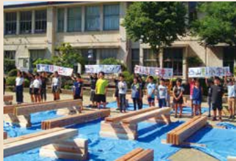
▲みんなで作る選手村ベレッツプラザイベント 刻印・仕上げ塗装 (西山形小学校・令和元年5月24日)