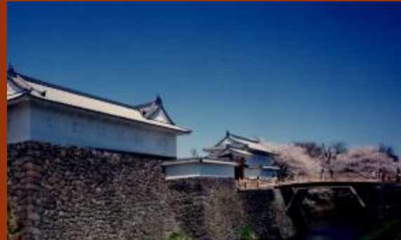
霞城公园 二之丸东大手门