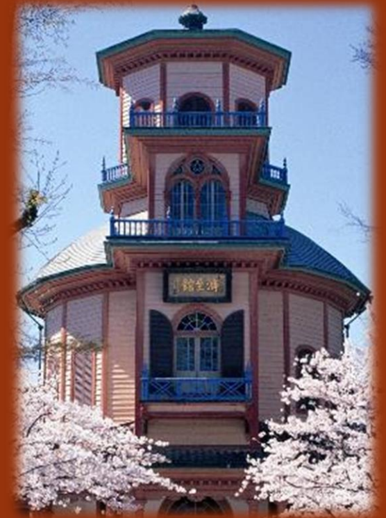
国家重要文化遗产