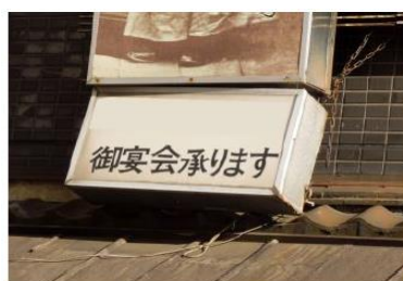
屋外広告物本体の傾き