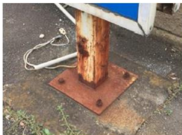
支柱、ベース、アンカーの錆び