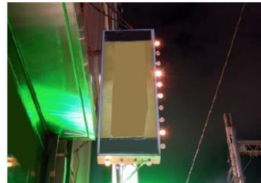
照明の一部不点灯