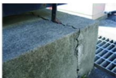
基礎部にひび割れ