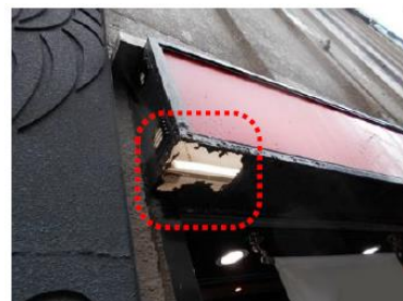
広告板底部の腐食