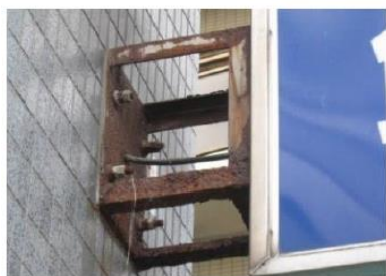
ブラケット・取付部の腐食