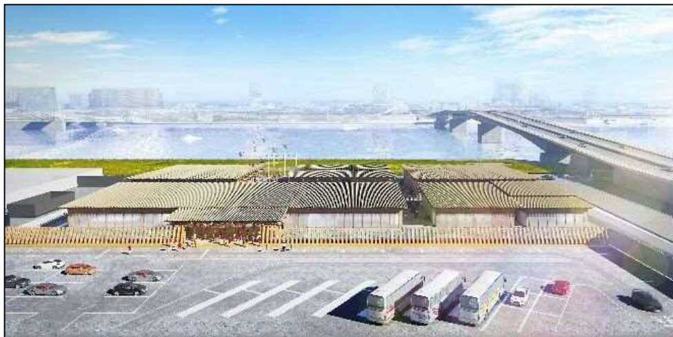
(2018年10月時点のイメージ図)