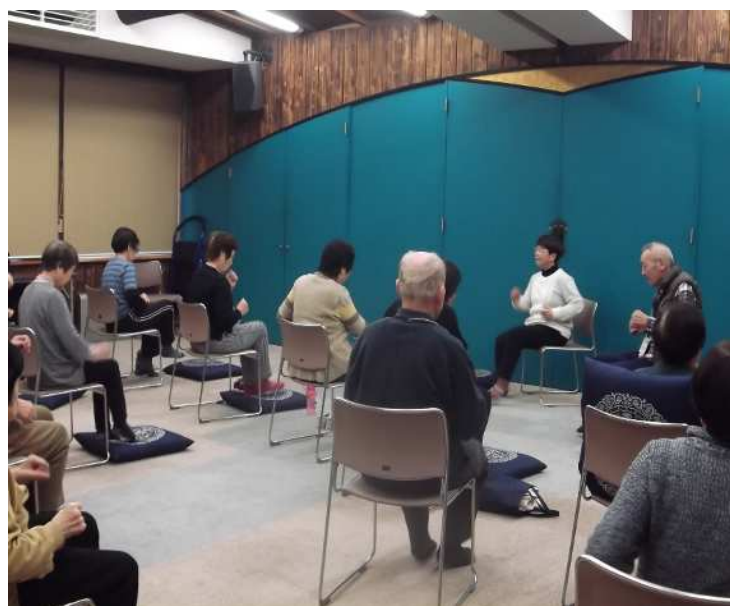
【インストラクターと 体操している様子】

【お問合せ】 長寿支援課予防推進係 TEL:641-1212 (内線567・568)