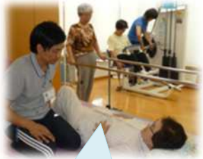
洗濯物が干せるようになった