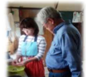
味付けの工夫を教してもらい、食材選びの幅が広がった

糖尿病の糖質制限で、食事がおいしくない。栄養指導は「食べてはだめ」といわれるから嫌だけど、体の事が心配。