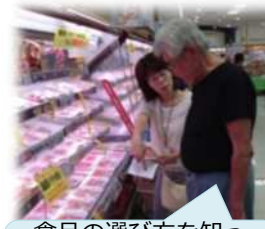
食品の選び方を知って、食事作りが楽になった。