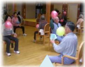
歩いて買い物に行けるようになった