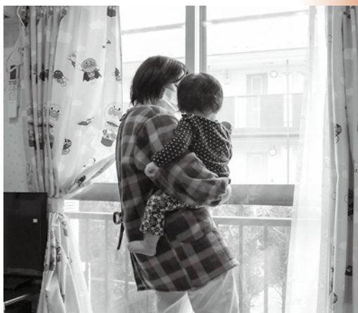
あたたかい日差しを浴びてリラックス

すで少しずつ安心して過ごせるようになります。抱っこをしたり絵本やおもちゃで遊んだりして、どんな遊びが好きなのかを探り、楽しい気持ちでのびのびと過ごせるようにしながら、お子さんの体調や変化に合わせてお世話をしています。