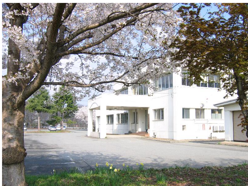
山形市食肉衛生検査所