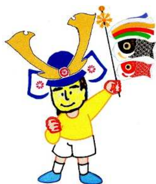
西部公民館マスコット「大地くん」