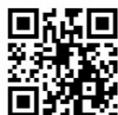
【山形市 待ち人数確認ページ】

問い合わせ先:山形市役所 市民課 Tel 023-641-1212 (内線345)