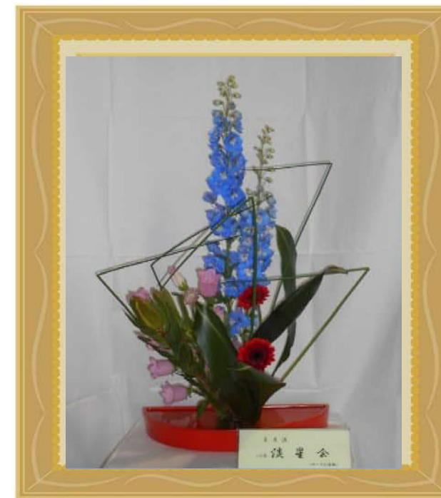
《花材》 フトイ、レウカデンドロン つりがね草、旭ハラン デルフィニューム、ガーベラ