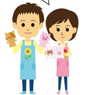
昨年の開催内容です