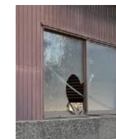
窓が割れた管理不全空家