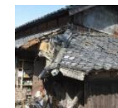
緊急代執行を要する崩落しかけた屋根