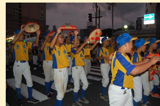
台南市 野球チーム来形