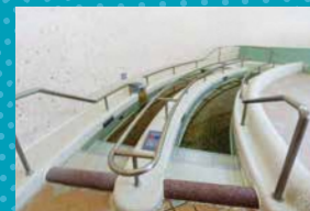
② ウォーキングプール