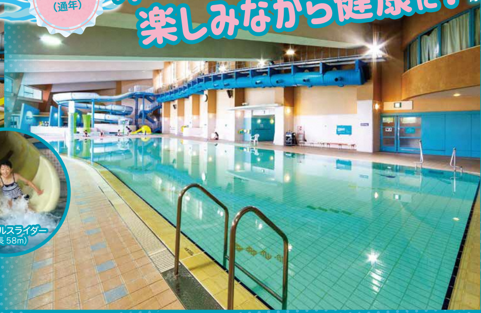
■ジャブジャブプール (幼児用) 水深 0.3m