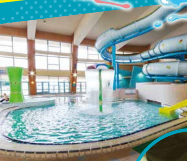
■キッズプール (子供用) 水深 0.6m