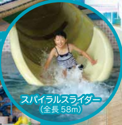
スパイラルスライダー (全長 58m)