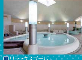
① リラックスプール