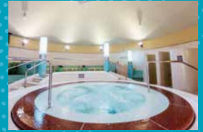
⑤ 屋内ジャグジープール