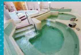
③ バブルプール ジェットプール