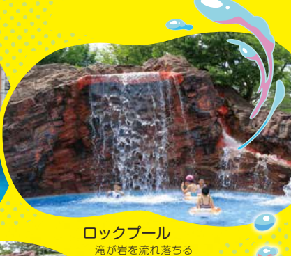
ロックプール 滝が岩を流れ落ちる野趣豊かなプール