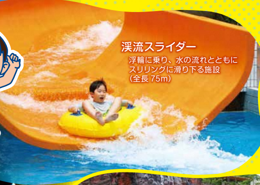
漂流スライダー 浮輪に乗り、水の流れとともにスリリングに滑り下る施設 (全長 75m)