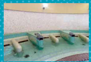
④ スリーピングプール