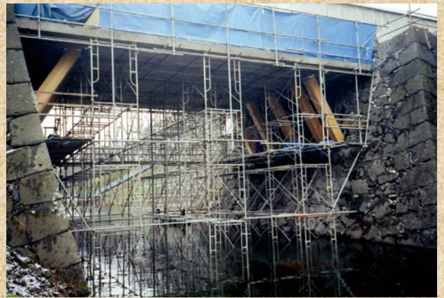
大手橋復原工事の様子