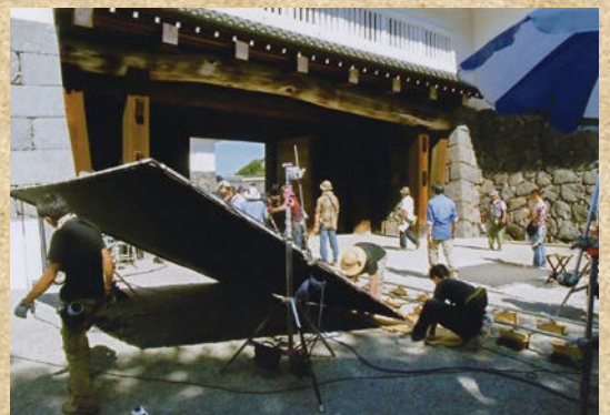
「超高速!参勤交代」撮影の様子 （協力：松竹）