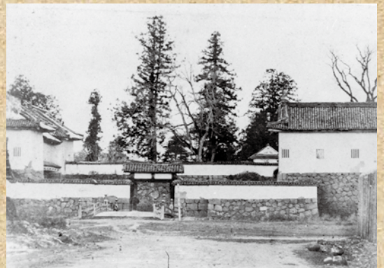
明治初期の二ノ丸東大手門

山形城は本丸及び二ノ丸が城郭の中心部となっていたため、軍事的な機能だけでなく、藩主の威厳を示す役割も有していました。復原にあたっては、最も史料が残る、江戸時代中期（堀田氏時代）の姿で復原しました。