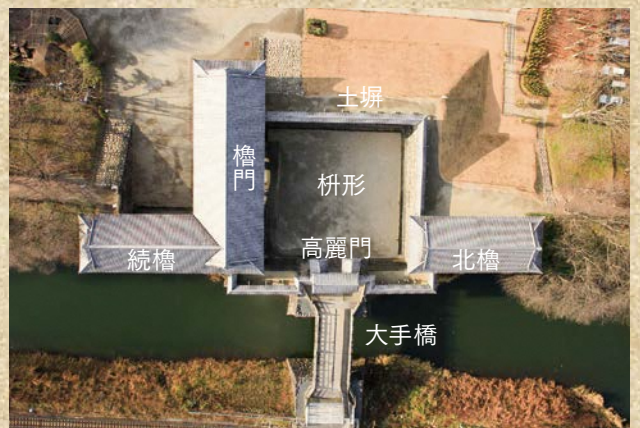
上空からみた二ノ丸東大手門