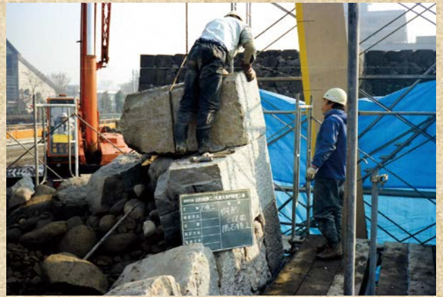
石垣積み直しの様子

東大手門を構成する建物群の中で最も規模の大きいものです。古写真と絵図面を基に、現存する石垣から寸法を割り出し復原しました。櫓の内部構造については、図面が残っていないため、城内の他の建物の図面を参考にしました。