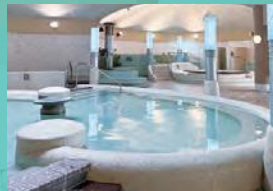
1 リラクゼーションプール