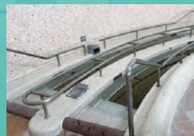
2 ウォーキングプール