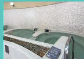
4 スリーピングプール 5 屋内ジャグジープール