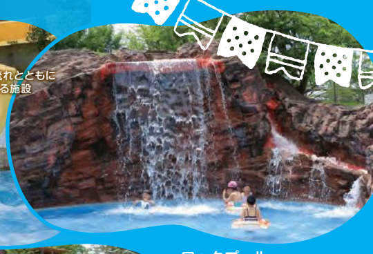
ロックプール 滝が岩を流れ落ちる野趣豊かなプール