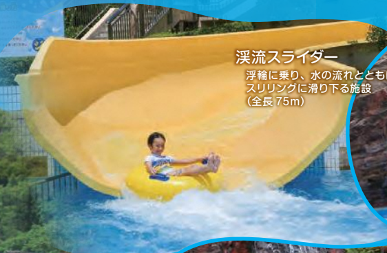
溪流スライダー 浮輪に乗り、水の流れとともにスリリングに滑り下る施設 (全長75m)