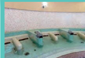
4 スリーピングプール