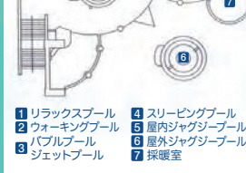
3 バブルプール ジェットプール