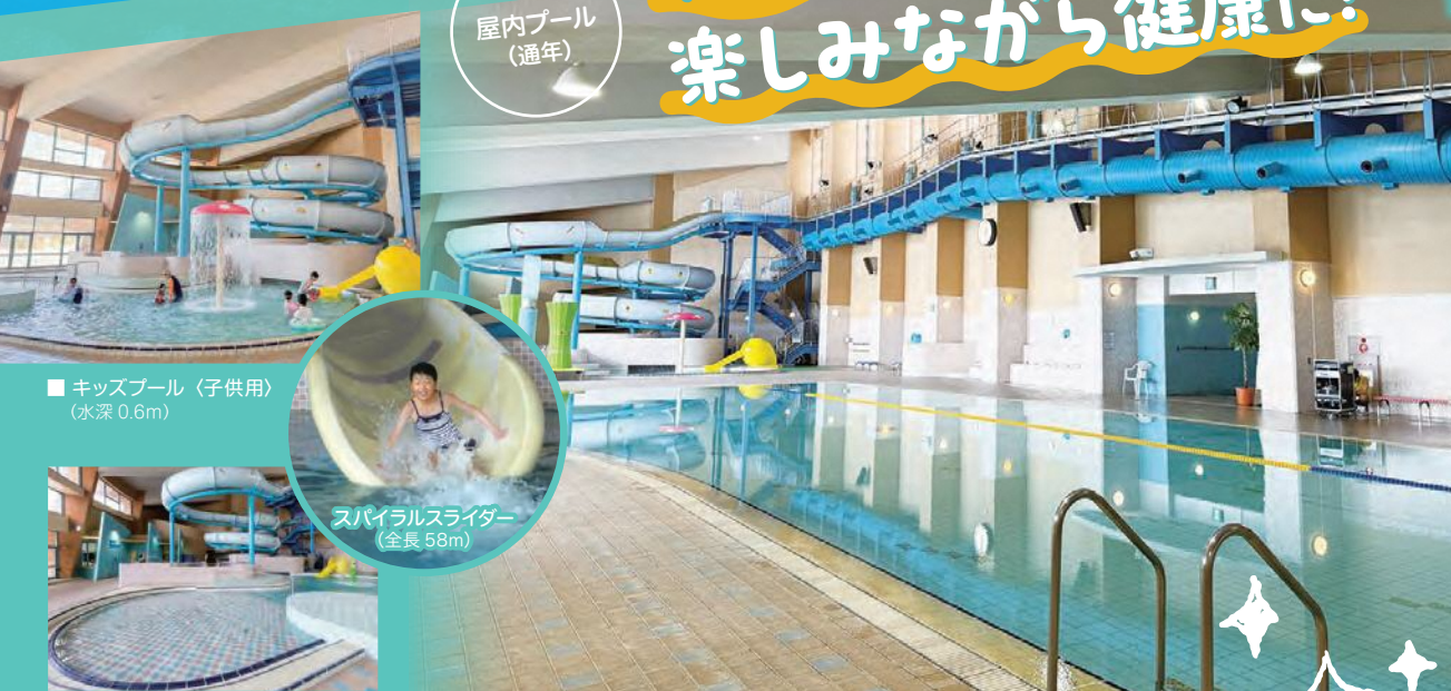
■キッズプール (子供用) (水深0.6m)