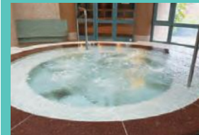
5 屋内ジャグジープール