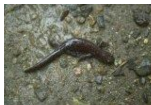
＜トウホクサンショウウオ＞

春、緩い流れの水溜まりのようなところに産卵し、夏、小さな沢の水溜まりなどで、幼生をよく見かけます。成体は、背面が暗褐色～黒褐色で淡い斑点があり、腹側は灰白色で微少な褐色斑が密にあります。