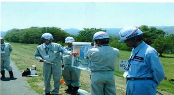
↓国から重要水防箇所の説明