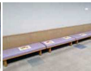
距離をあげた席の配置