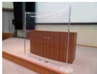
ビニールカーテンの設置