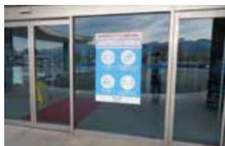
正面玄関 啓発サイン

今後も引き続きご来館いただく皆さまの安心安全のため感染防止対策に努めてまいりますので、ご来館の際はご協力いただきますようお願いいたします。