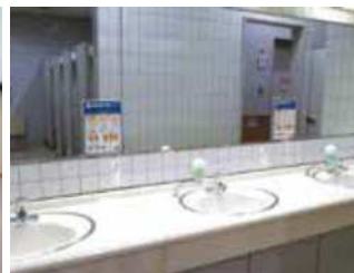
トイレでの注意喚起