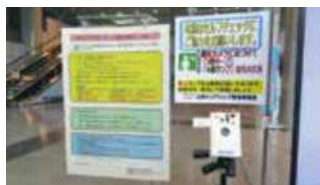
正面入口体表面温度計と来館者案内