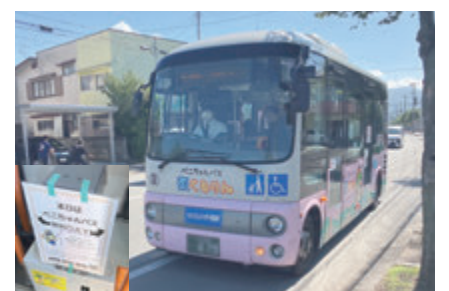
▲イベントに併せて無料運行されたベニちゃんバス

識しているため、他自治体の状況などを調査研究していく。 Q 全国で導入が進む市営住宅の共益費の行政徴収制度を本市でも導入してはどうか。 A 自治会役員の担い手不足などの問題が発生しているため、行政としてどのような対応ができるのか、他自治体の状況などを調査研究していく。