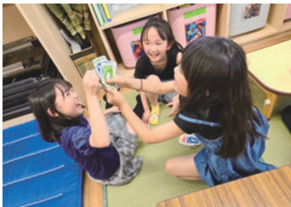
▲宿題したから、楽しく遊ぼうね！

政運営を行っている。 子宮頸がん予防接種委託料 1億3,173万円 ※ キャッチアップ接種の最終年度となることから、子宮頸がんワクチンの接種者が当初を上回る見込みであるため、委託料を増額します。 委員 キャッチアップ接種回数当初の見込みと現在の想定はどうか。また、令和6年11月29日付けで、キャッチアップ接種の経過措置に関する通知が国から出されているが、周知などの対応は今後のように行うのか。 母子保健課長 当初はキャッチアップ接種回数を3590回と見込んでいたが、実際には8348回となる見込みである。また、国からの通達に基づく対応は、6年12月に開催予定の自治体説明会で、今後のスケジュールや周知・広報の内容が示される予定であることから、 説明会の内容に基づいて検討したい。