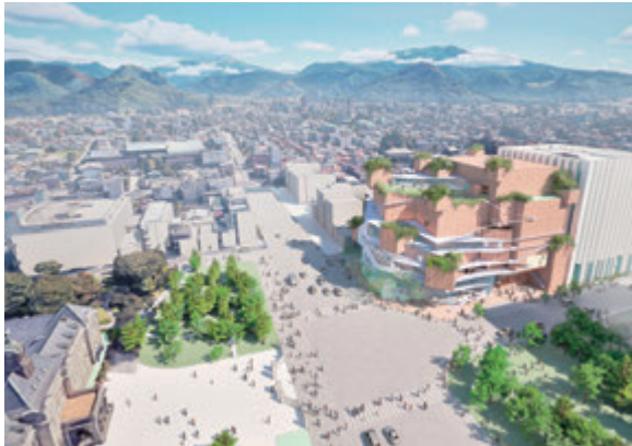
▲コンセプトは「BIG-TREE」、新市民会館

は可能である。 会議室などのお茶会 置しない予定であるが、 め、新市民会館には設 でに設置されているた もみじ公園内などにす との意見もあったが、 室を設置してはどうか 明している。また、茶 スとして使用可能と説 一体化して展示スペー タジオとギャラリーを の意見があったが、ス を設置してはどうかと 室長 展示専用の部屋 文化スポーツ施設整備