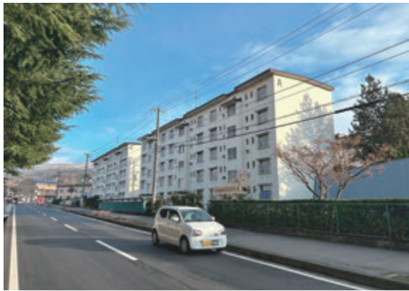
▲長寿化計画の見直し控える市営住宅

委員 子育て世帯や高齢者、障がい者など、特に居住の安定を図る必要のある人の入居収入基準を月収25万9000円まで引き上げるとのことだが、入居後に入居収入基準を超えた場合、すぐに退去しなければならぬのか。 住宅政策課長 市営住宅への入居後に収入が上がり、入居収入基準を超えることになった場合、 入居者に直ちに