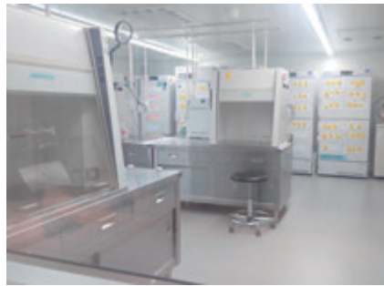
▲小さな命を救うために稼働する母乳バンク