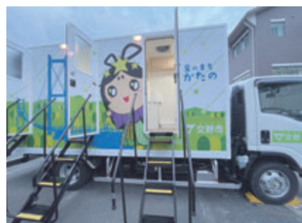
▲災害時にも大活躍のトイレトレーラー

A 勉強会や現地視察を行うなど、地域の理解を得た上で事業が進められるように丁寧な説明を継続していく。