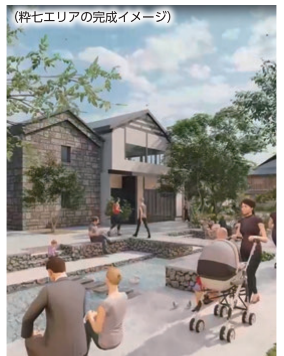
▲歩行者の回遊性向上を図り、歩いて楽しい空間を整備