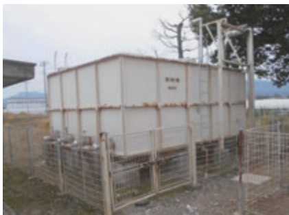
▲受水槽と給水方法の見直しでコスト削減を