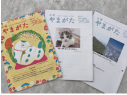
▲今後の在り方の検討を！