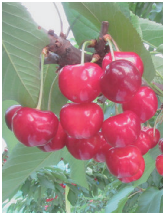
▲高温耐性のある「やまがた紅王」

委員 ウェブでの出願手続きの方法はいつ公表されるのか。 商業高等学校事務長 令和7年12月下旬からウェブ上での入力を行う想定となっており、県から保護者などへの説明も併せて行われると認識しているが、現時点では未定であるため、県の動向を注視していきたい。