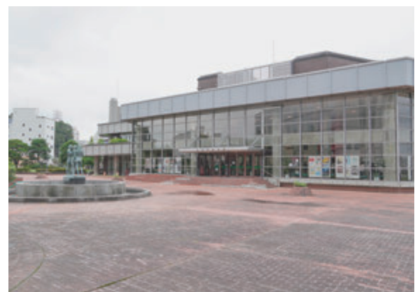
▲たくさんの思い出が詰まっている現在の市民会館