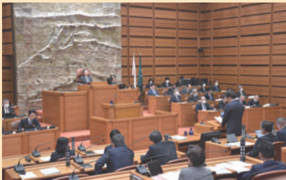
▲執行部と向き合って議員が質問

* 市議会議員選挙の後、初めて開かれる定例会では、初当選した議員全員が一般質問を行います。