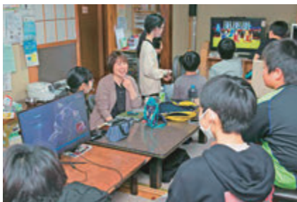
▲子どもの居場所づくりに取り組む フリースクールに支援を