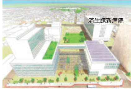
▲済生館新病院と周辺エリアの再開発後イメージ（令和5年12月時点）

Q 済生館では小児入院患者の付添者の負担軽減のため、以前から要望のあった付添者からの弁当注文受け付けを令和6年度に開始し、感謝の声が寄せられているが、さらなる負担軽減のため、小児病棟へ保育士を増員してはどうか。