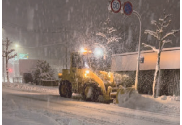
▲安全確保に向けて、夜間も除雪

なっている返礼品を含め、経費率は寄付額の50%以下となければならないため、 寄付額の半分が利益 として本市に