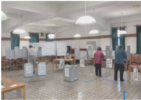
▲市内78カ所に投票所を設置

委員 急な選挙日程となったことから、これまで投票所として使用していた地区のコミュニティセンターな