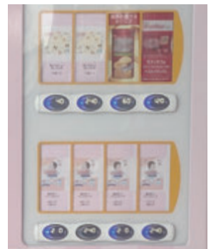
▶全国的に普及が進むおむつの自動販売機

Q 乳幼児と外出した際の不便を解消するため、おむつの自動販売機を市有施設へ設置し、子育て世帯が安心して外出できるように支援してはどうか。 A 全国の公共施設や民間施設への設置が進んでおり、小さな子ども連れの方が多く訪れる市有施設への設置を研究していく。