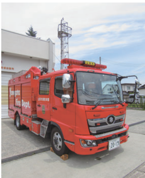
▲消火栓がなくても放水できる水槽付消防ポンプ車

場所でも 迅速に消火活動 ができることだが、 一般的な火災を消火するためには、2000リットルの水量で足りるのか 。 警防課長 建物火災で全焼火災の場合などは、1隊の消防ポンプ車だけでなく、消防団のポンプ車も含めて、複数の消防隊の消防ポンプ車が臨場し、タンクの水だけでなく、消火栓や防火水槽の水も使用して、消火活動を行っている。火災の規模次第では、2000リットルの水で足りることもあるが、 足りない場合には、追加の消防ポンプ車が臨場して消火活動に当たることとなる 。