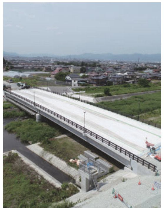
▲新しい道路橋でさらなる交通利便性の向上へ

委員 芋煮広場の利用方法はどうか。 公共交通課長 利用者が事業者に食料金や機材などの借料金を支払い、利用者自身が芋煮やバーベキューを行う形となる。