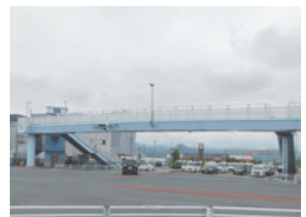
▲南沼原小学校前歩道橋の東西方向早期整備を

Q 南沼原小学校前交差点の東西方向への歩道橋整備に向けて、県への働きかけを強めてはどうか。 A 県から、「歩道橋の整備には交差点北東部への左折レーンの整備と併せて検討する必要があるため、事業用地の確保が課題」と聞いているが、整備に向けて要望を継続していく。