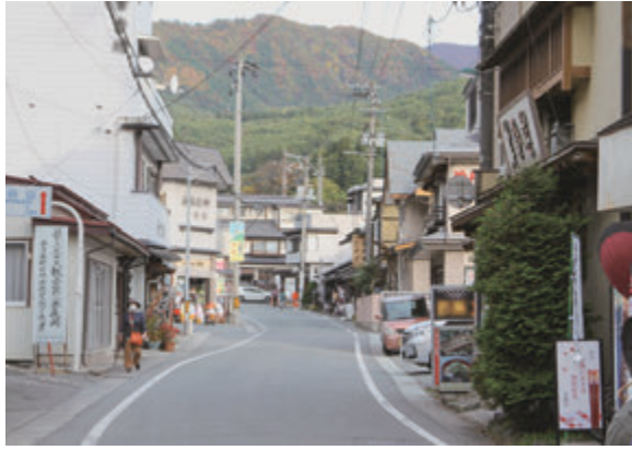
▲景観形成でさらなる誘客促進を

委員 事業の完了予定はいつか。 まちなみデザイン課長 令和2年度から国の交付金を活用して事業を推進しているが、期間が5年間でとれているため、 6年度に一度評価 を行いたいと考えている。また、景観形成には長期にわたる取り組みが必要であり、現時点では、さらに5年間延長して、 おおむね10年間を目途に事業を推進 したいと考えている。