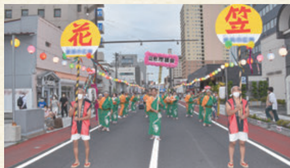
▲令和4年度の「山形花笠まつり」の様子