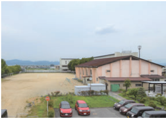
▲施設配置を再編する出羽小学校の各施設

電子商品券をクレジットカード払いなどで購入する際の販売手数料と、売り上げ分を各店舗へ振り込む際の銀行手数料などとして約5500万円を見込んでいます。