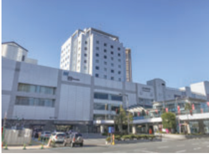
▲山形市のターミナル、JR山形駅