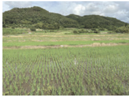
▲食料供給など重要な位置を担う中山間地域農業

Q 農業従事者の高齢化や担い手不足が進んでいるが、持続可能な農業の振興のため、どのように農業DXを推進していくのか。