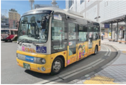
▲(仮称)北くるりんでも市民のニーズに基づいた利便性の高いルート設定を