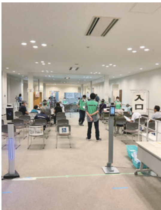
▲集団接種は引き続き市保健所で実施

観光戦略課長 観光関係の専門家であるJRR東日本や観光関係の研究所を持つ慶応義塾大学、地元関係者である観光関係団体の代表者などと市職員で構成する研究組織の共創ラボを立ち上げ、日本一の観光案内所の基本構想素案を策定するものである。なお、共創ラボの運営は業務委託する予定である。