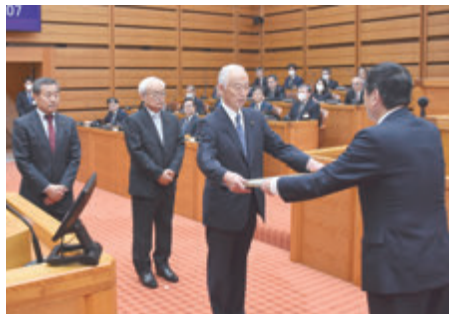
▲表彰状の伝達を受ける議員