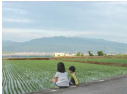
▲山形の未来を見据えて