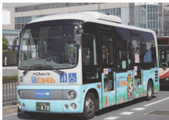
▲さまざまな公共交通が連携し、利便性向上へ

委員 都市構造再編集集中支援事業費補助金を活用して、霞城公園のデジタル映像コンテンツアプリの開発を行うとのことだが、供用開始後の維持費にも活用できるのか。 財政部長 現時点では、アプリの維持費への国からの補助は想定していないが、事業を進める中で確認していく。