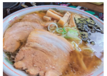
▲ラーメンで山形の魅力向上を図れ

検討を進めていく。 Q 二酸化炭素排出量の削減 のため、EV購入への補助制 度を創設してはどうか。 A 自動車から排出される二 酸化炭素の削減に向けた対策 は、ゼロカーボンシティ実現 のための重要な課題であり、 他自治体の取り組みを調査研 究していく。