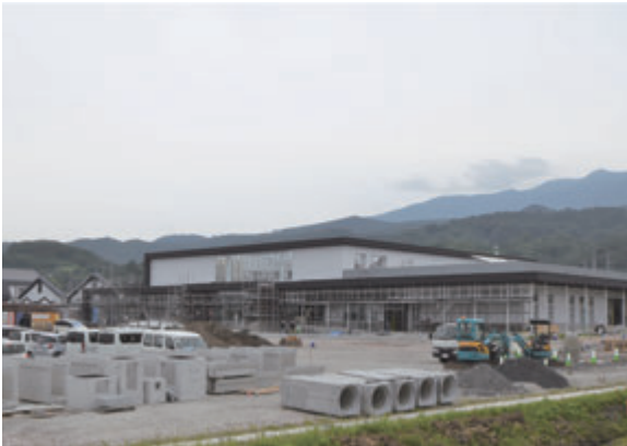
▲順調に工事が進む道の駅やまがた蔵王

委員 道の駅やまがた蔵王に設置されるバス停には、どのような路線バスが停車する予定なのか。 公共交通課長 山形駅から東京、蔵王温泉から東京への高速バスや上山から仙台への都市間バス、山形から上山への路線バスの誘致に向けて交通事業者と協議を行っており、その他の路線も随時協議を行っていく。