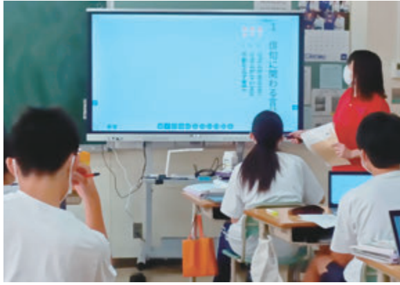
▲電子黒板を活用し、より充実した教育の実現を

委員 電子黒板の利用時間は、年間でどのくらいを考えているのか。 学校教育課長 令和4年度に情報教育推進校の3校で電子黒板を導入した際は、当初は利用されない時間帯もあったが、教員が電子黒板の活用方法を習熟するにつれて、空き時間が無いほどに活用が進んだことから、 最終的には常に稼働している状況になるのではな いかと考えている。