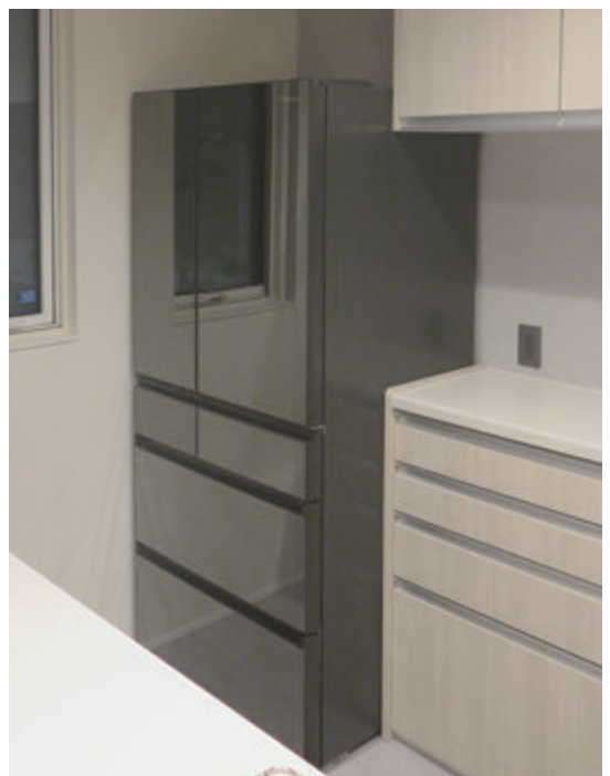
▲最新の省エネ家電への買い換えを後押し

農政課長 令和4年度にも肥料などの価格高騰対策として補正予算で支援を行った経緯があり、5年度も価格上昇分の一定率で補助を行うものである。他にも経営安定に向けた施策を講じており、今後も支援策を総合的に検討していく。