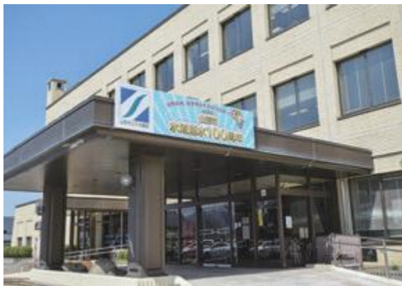
▲山形の水、安全安心を次の100年へ

委員 水道通水100周年記念事業の概要はどうか。 上下水道部総務課長 令和5年5月4日に水道通水100周年を迎えるが、6月1日から水道週間に合わせて6月2日に記念式典を開催し、感謝状贈呈式などを行う予定である。また、 未就学児を対象とした水道サマーフェスティバル の開催も予定している。