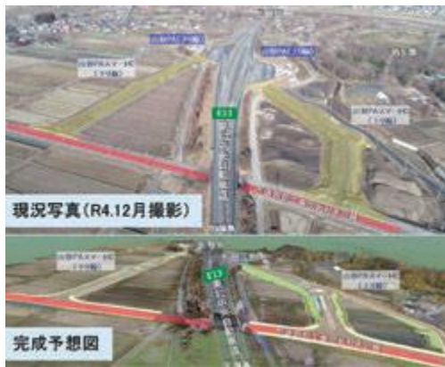
▲令和5年度に供用開始予定の山形PAスマートIC