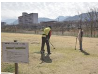
▲パークゴルフで健康寿命延伸を