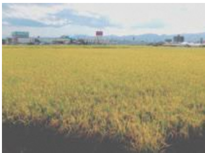
▲農業の危機、抜本の手立てを!!