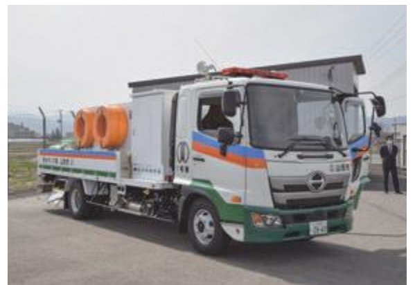
▲緊急時に備え、嶋地区に配備している排水ポンプ車

河川整備課長 市が管理する河川のうち、近年の大雨で内水氾濫があった箇所や、過去に水上がりがあった住宅地の周辺箇所を選定して、設置するものである。