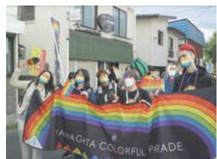
▲市内で行われたやまがたカラフルパレード

めてはどうか。 A 個々の医療機関で取り扱いを判断している状況であり、今後、性的マイノリティの社会的理解を深める取り組みを推進していく。市営住宅の入居申し込みでは、同居者とすることができると親族に同性パートナーは含めていないが、今後、制度の見直しを検討していく。