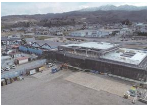
▲オープンに向けて工事が進む道の駅「(仮称) やまがた蔵王」