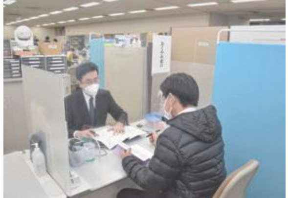
▲ご遺族の負担解消を図るおくやみ窓口

防災対策課長 令和5年8月 の最終週に山形ビッグウイ ンで開催予定であり、VR映 像で洪水などの体験ができる ブースの設置や、消防車両や 自衛隊車両の展示、炊き出し などを行う予定である。