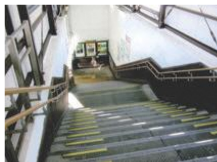
▲山寺駅の階段へエスカレーターを

Q 農産物は物価高騰に伴う価格転嫁が難しいため、肥料代へ補助を行うなど、基幹産業である農業への支援に取り組んではどうか。 A 物価高騰は、新型コロナウイルスや国際情勢の影響であるため、引き続き国へ総合的な対策を要望するとともに、市内農業者の現状を把握しながら、本市の支援策を検討していく。