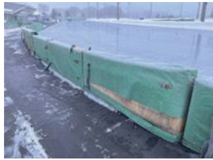
▲老朽化しているスケート場の備品

A 令和5年度の本市の組織改正で「働きやすさ追求室」を新設し、マッチング機会の拡充やニーズに応じた丁寧な情報提供などを強化したいと考えている。暮らしの面でも公共交通の利便性向上など大学生の行動範囲の拡大に向けた取り組みを進めるなど、本市の良さを広く認識してもらるように努めていく。