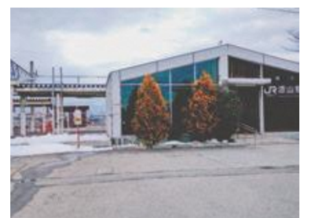
▲東口開設が待たれる漆山駅

見交換している。費用対効果の精査などの課題があるが、引き続き解決策を探っていく。 Q 出羽小学校の体育館とプールの整備計画はどうか。 A 5年度にプールの整備、7年度から屋内運動場の改築、9年度に外構工事などを行う予定であり、学校や地域の理解を得ながら進めていく。