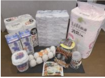
▲物価高騰が続く生活必需品