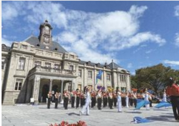
▲爽やかな秋空の下、やまがた秋の芸術祭

をリースして、市役所地下駐車場に保管しながら庁用車として使用する。市が使用しない休日は、市役所1階エントランスに保管しながら、事業者が市民や観光客などへ貸し出す想定である。