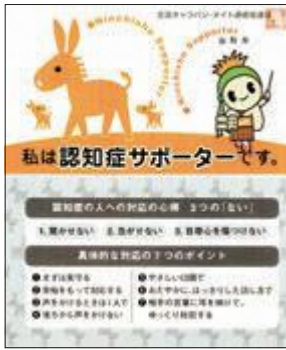
▶認知症施策のさらなる推進を

A 市民の認知症への理解を深め、認知症と共に生きる機運の醸成や、本人と家族に安心を与え、認知症への早期対応や認知症高齢者が自由な意思で外出し、安心して活動できる環境づくりにつながることを考える。