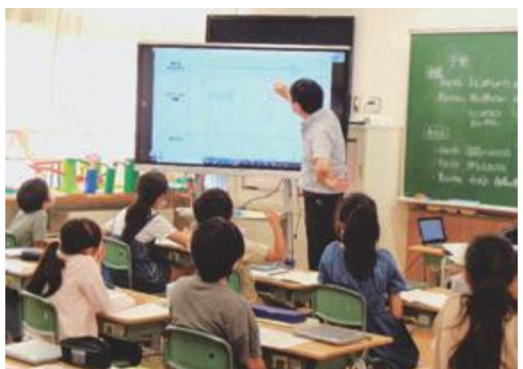
▲ICT機器の導入で先進的な学習スタイルへ

に254台、特別教室に65台 電子黒板を設置すること だが、どのように設置台数を 算定したのか。また、どのよ うに活用していくのか。 学校教育課長 電子黒板は階 段で他の階へ移動させること が困難であるため、各階に1 台は配置する必要がある。ま た、各クラスで1日に1、2 回は活用できるように、普通 教室には、3クラスに1台の 割合で設置するものである。 電子黒板はデジタル教科書の 表示のほかにも、子どもたち が自分のタブレットに入力し た意見や考えを集約したもの を映し出し、全員で共有を図 ることなどに活用していく。