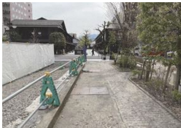
▲周辺との調和のとれた御殿堰へ

まちづくり政策課長 まずは無散水消雪歩道の整備などを行うが、御殿堰本体は用水路であるため、水を利用しない秋頃に着工し、全体の完成は5年度末を予定している。当該地の北側に隣接する民間事業者の建て替え後の意匠を考慮しながら、上流に位置する水の町屋七日町御殿堰とほぼ同様のイメージで整備したいと考えているが、既に当該地の南側に洋風の植栽が整備されているため、植栽は上流側とは異なる形となる予定である。