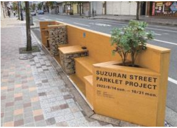
▲令和4年度の社会実験で設置されたパークレット

学校教育課長 校内フリースクールのような居場所づくりで実績をあげている事例があるため、本市でもモデル校を設置することとし、ソファやパーティション、水槽などを設置し、環境整備を行うも