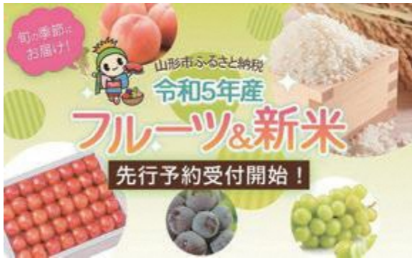
▲フルーツの先行予約などが好評で 令和4年度の本市への寄付額は40億円を突破!