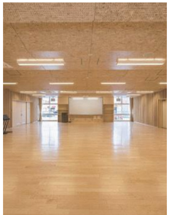
▲市民に開放される南沼原小学校の第一音楽室

ている。特別教室を使用する際には、学校の中に入ることになるため、防犯対策としてシャッターで区切る必要があることから、改築などを行った学校を条例に定めている。