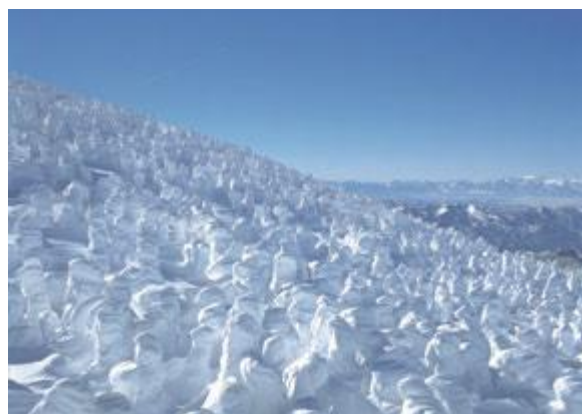
▲世界に誇る樹氷で国際観光を推進

委員 日本三大樹氷ブランド化誘客推進事業のこれまでの成果はどうか。 観光戦略課長 樹氷が3市だけではなく、 東北共通の冬の貴重な観光資源と認識 され、キラコンテンツとして、観光ルート化するという目標が共有されたと考えている。