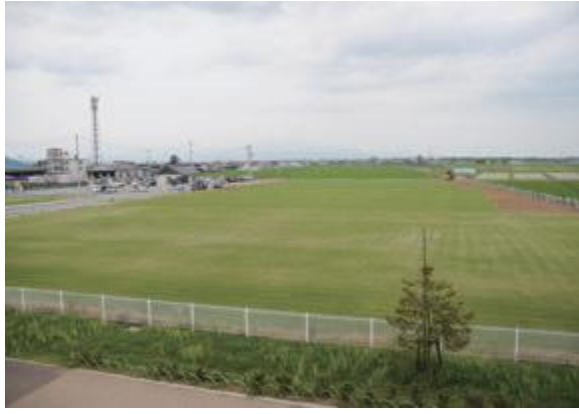
▲供用開始に向け整備中の山形市グラウンド・ゴルフ場

委員 使用料はどのよう に決定しているのか。 また、芝の管理はどの ように行うのか。 スポーツ保健課長 使 用料は、 施設の管理費 用をベース に、受益者 負担適正化の基本方針 に従い積算し、近隣市 町村の同様の施設の使 用料も参考に設定して いる。芝の管理は、 お おむね1週間に1回の 割合で芝刈り などを 行 う 予 定 で あ る。