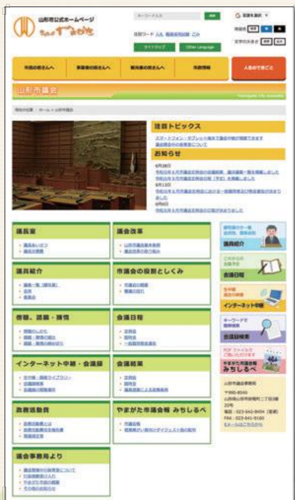
▲市議会ホームページのトップ画面