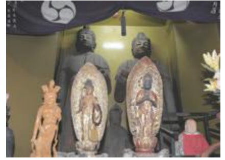
▲蔵王地区の観光資源「松尾山観音」