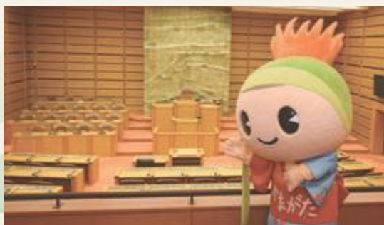
▲本会議場の傍聴席は65席、車椅子席は2席あります