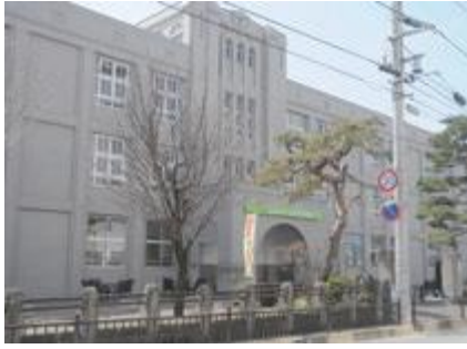
▲山形まなび館を拠点に中心市街地の活性化を