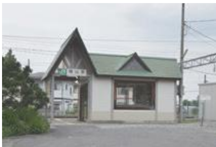
▲駅北側への市道整備とロータリー設置が待たれる楯山駅