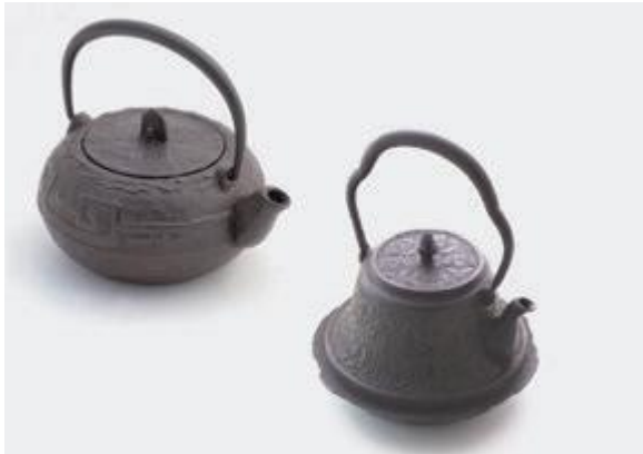
▲返礼品の山形市伝統工芸品 山形鑄物

委員 ふるさと納税制度の見直しに係る条例改正には、どのような背景があるのか。 市民税課長 過度な返礼品などに関して、総務省の見直し要請に従わなかった自治体があったことが大きく、市民税の寄付金特例控除の対象は、 総務大臣