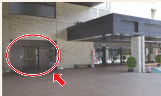
▲市役所正面入口の左側が市議会入口です