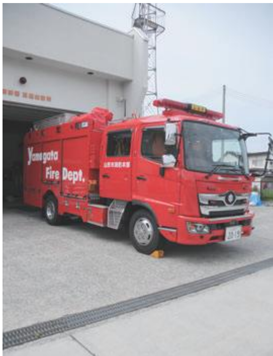
▲市民の安心・安全を守るため、平成30年度更新した消防車両

委員 収入や維持管理費は、 どのように見込んでいるのか。 スポーツ保健課長 収入は年 間約300万円、維持管理費 は 年間約3000万円 を見込 んでいる。