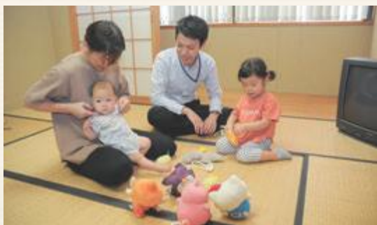
▲議会開催中開放している保育室(おもちゃの用意はありません)