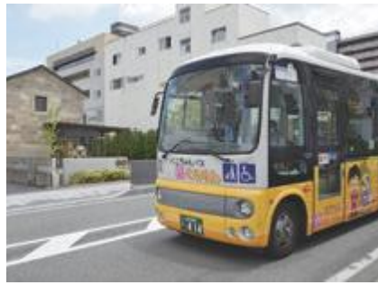
▲ベニちゃんバスの新規路線開設を

Q 馬見ヶ崎や嶋北地区の開発が進み、北部公民館の担当地区は建設当時から大きく広がっている。松葉の木公園集