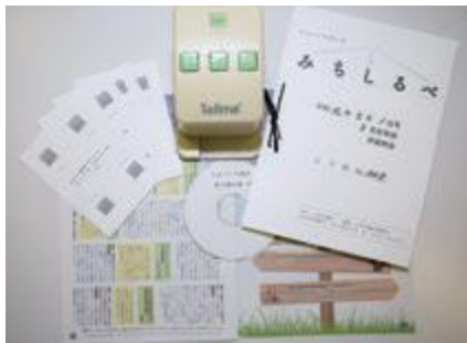
▲元になるみちるべの上に左から音声コードとコード読み取り機、声の議会報、点字版