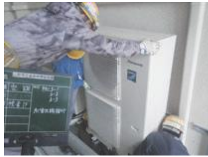
▲設置が進む小中学校の空調設備

Q 小学校へのエアコン設置は令和元年度内の設置完了に向け工事を進めていると聞くと、今夏の暑さ対策はどうか。