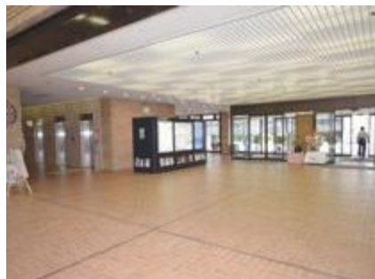
▲早急に歩行誘導マット設置を！