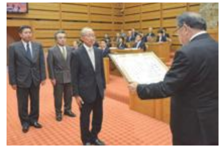
▲6月定例会開会日に、表彰状の伝達を受ける議員