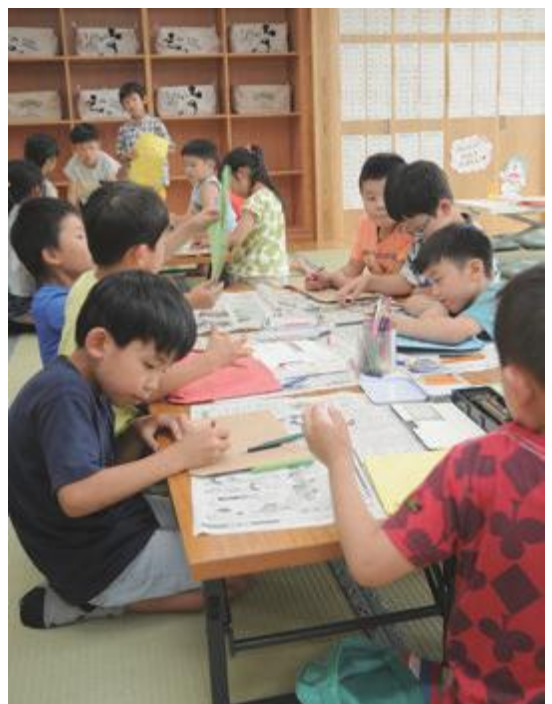
▲子どもたちが安心して過ごすための放課後児童クラブ