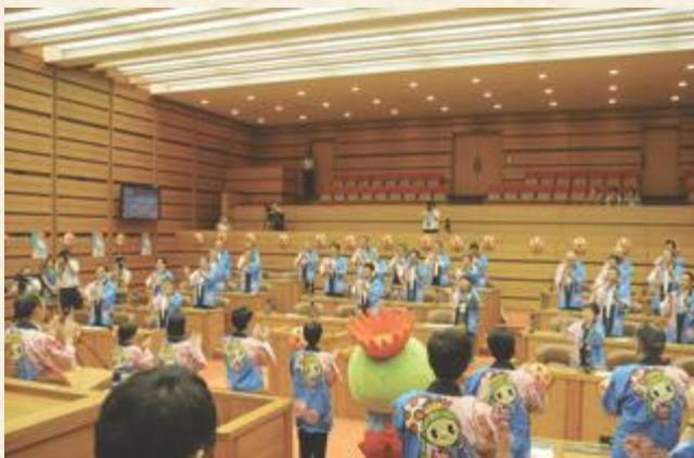
▲花笠締めで「山形花笠まつり」の成功を祈念 (平成30年度開催の様子)