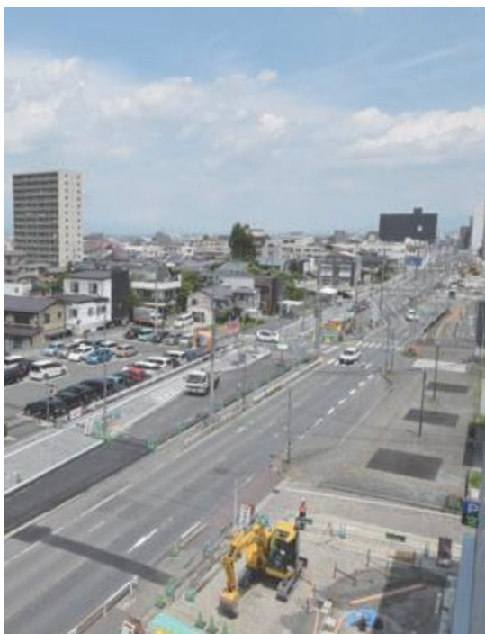
▲街路整備中のN-GATEの北側工区

委員 河川の逆流防止についても支援の対象となるのか。 農村整備課長 河川の逆流防止は、第一義的に河川管理者が管理すべきものであるが、被害が生じる場合は、農地維持に支障が出ないか、関係活動組織と活動計画を協議しながら対応することになる。