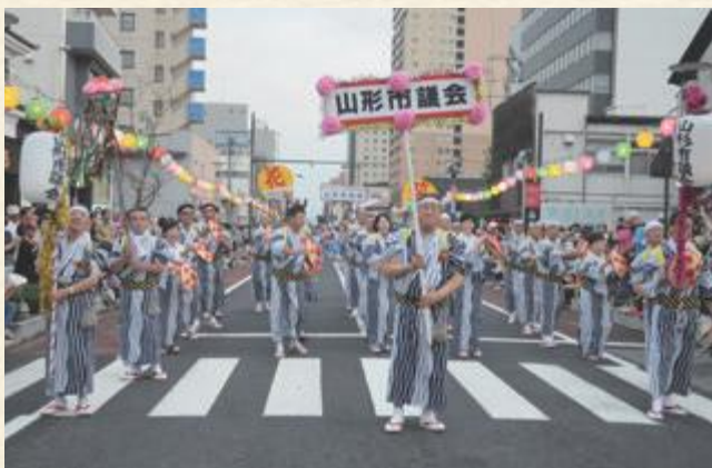
▲平成30年度の「山形花笠まつり」の様子

山形の真夏の夜を彩る「山形花笠まつり」を盛り上げようと、議員が企画した議場でのPR（花笠議会）が、7月臨時会の開会に先立ち行われました。